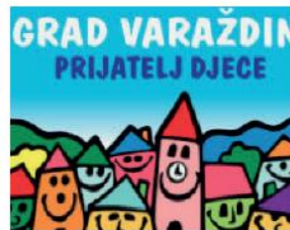
slika 1. Počasna ploča Grada – prijatelja djece